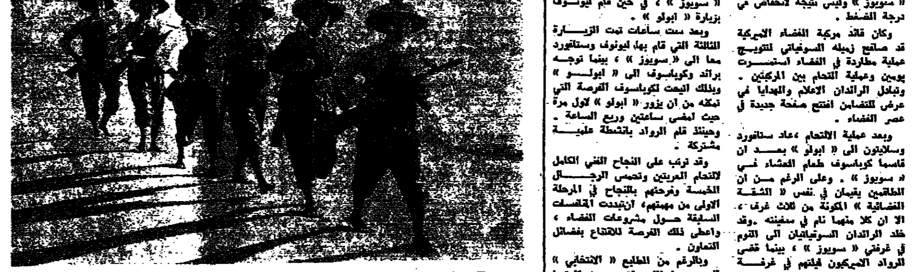
مليشيا مقاطعة «كوانغ نونغ» تحمي الصيد الخاص بالثدياء... (Caption for the militia photo.)